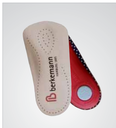
BERKODUR, HALB / BERKODUR, HALB 08759-700 natur natur Gr. 2 - 13 | Damen • Herren Gr. 2 - 13 | Damen • Herren