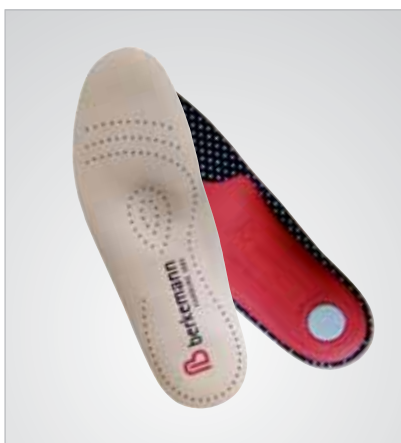
BERKODUR / BERKODUR 08758-700 natur natur Gr. 2 - 13 | Damen • Herren Gr. 2 - 13 | Damen • Herren