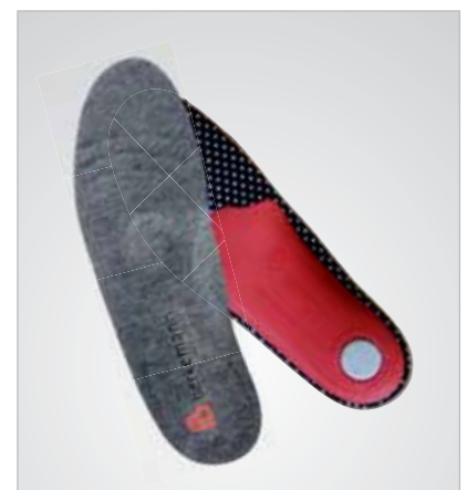
BERKODUR, WARM / BERKODUR, WARM 08760-600 grau grau Gr. 2 - 13 | Damen • Herren Gr. 2 - 13 | Damen • Herren