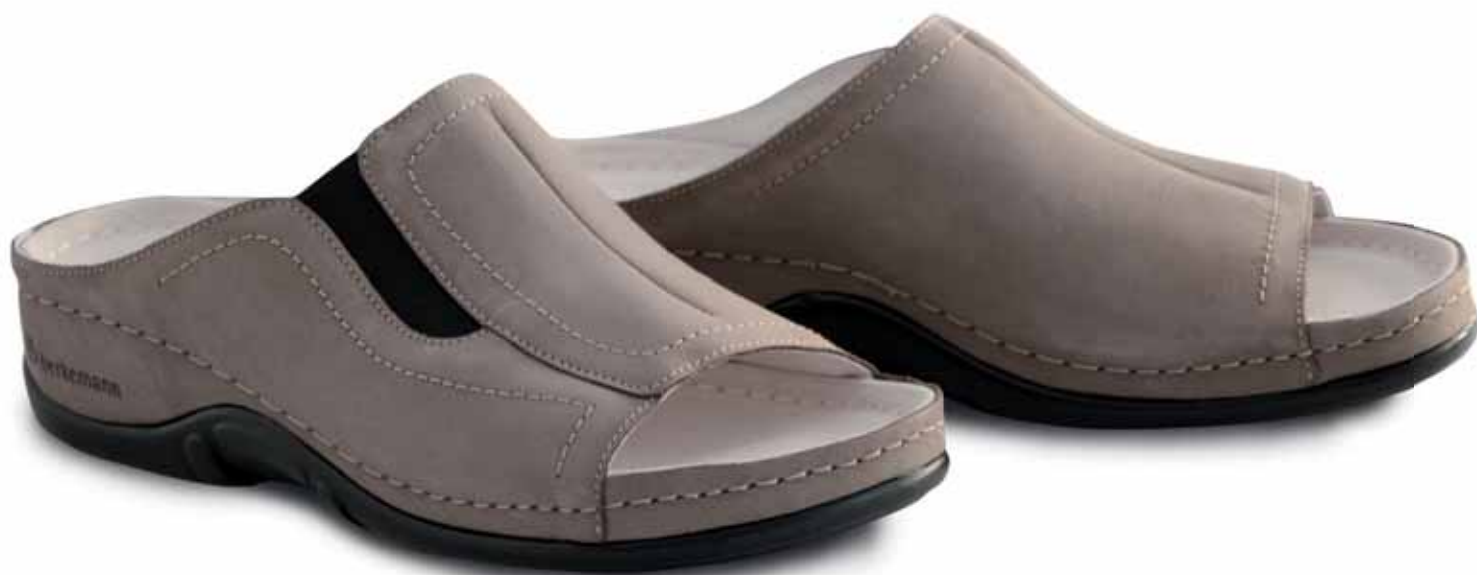
01105-967 stone • Nubuk stone • Nubuk

Die perfekte Passform wird beim Modell „Isabella“ durch den Gummizugeneinsatz gegeben. Die perfekte Passform wird beim Modell „Isabella“ durch den Gummizugeneinsatz gegeben.